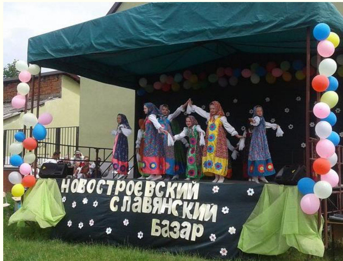
Новостроевский славянский базар