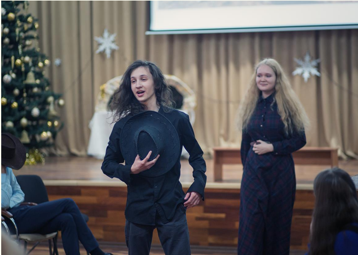
Театр на Зеленой улице МАОУ СОШ № 38