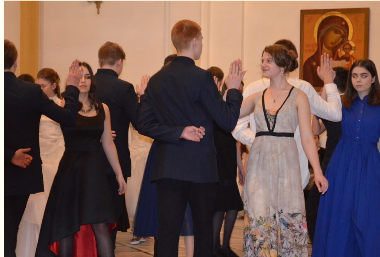
Сретенский бал в Православной гимназии