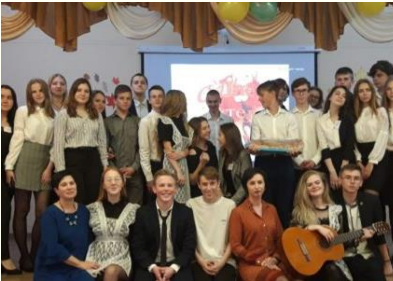
Наша школа – наша жизнь. День самоуправления МБОУ СОШ г. Мамоново