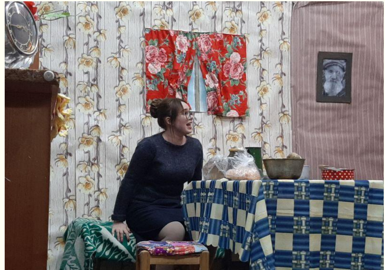
«Тимирязевские сезоны» МАОУ лицей № 5 г. Советска