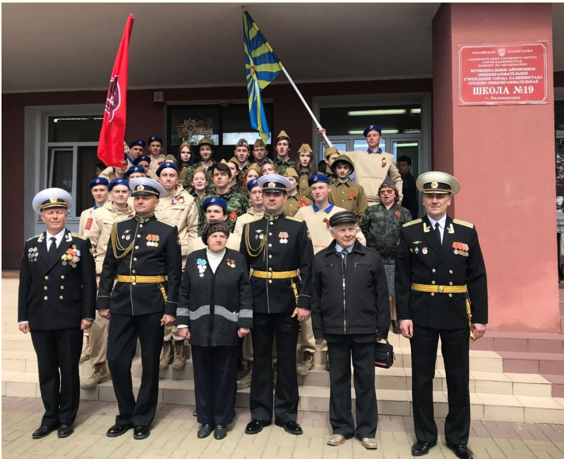
Юнармия: содружество поколений МАОУ СОШ № 19