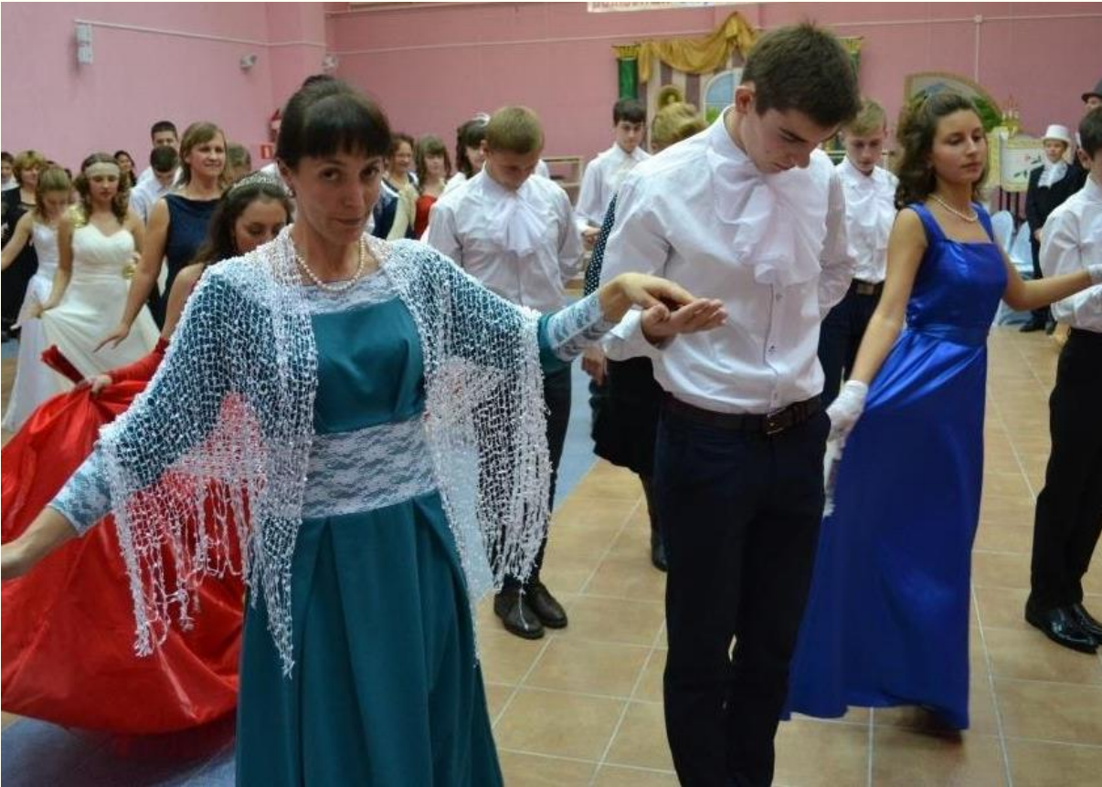
Бал в МАОУ СОШ № 3 г. Черняховска