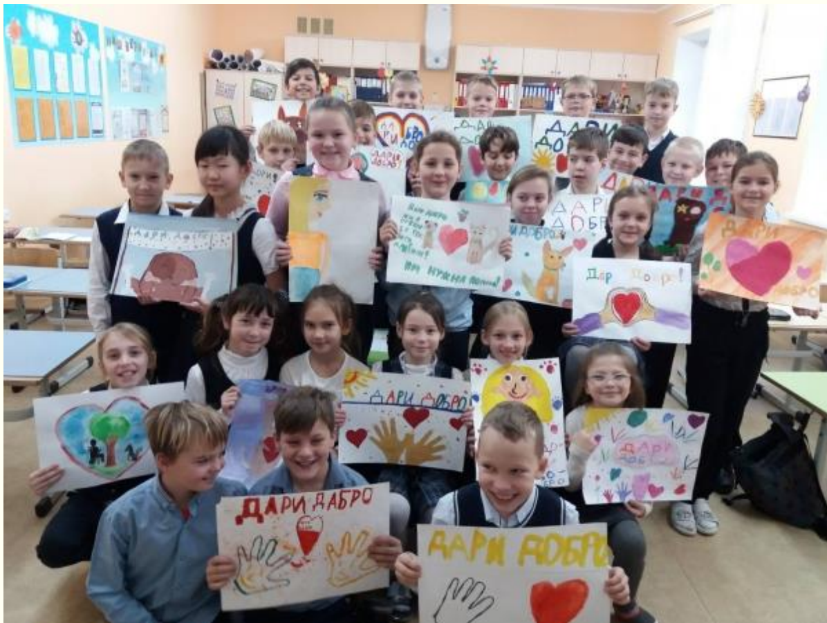
Добрые проекты МБОУ СОШ «Школа будущего»