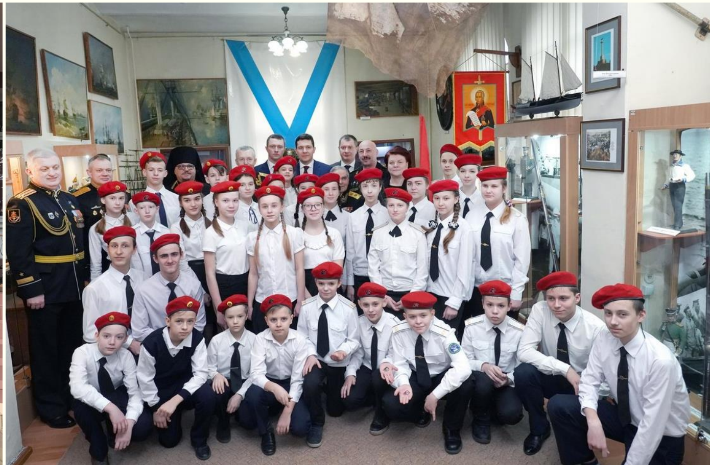
Юнармейцы МБОУ гимназия №7 г. Балтийска имени К.В. Покровского